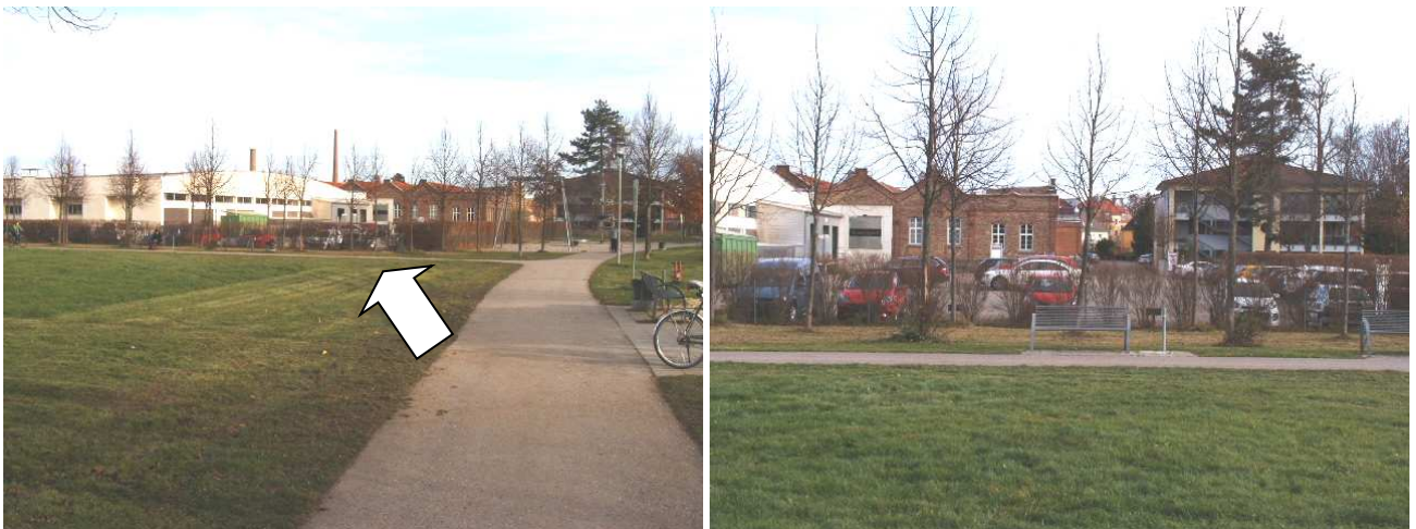
Direkt an der Grünfläche und am Spielplatz bietet sich der bish. Firmenparkplatz als Standort für eine KiTa an